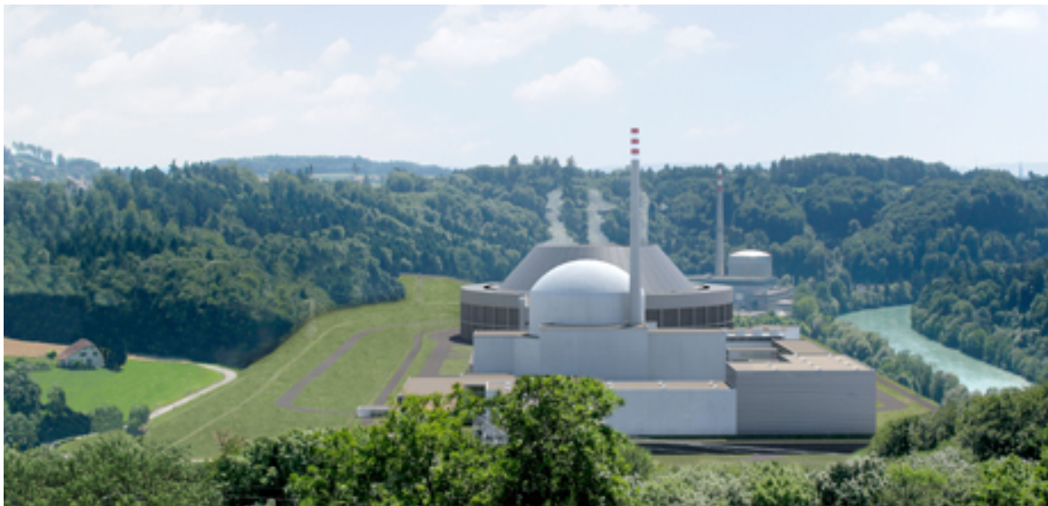
Fotomontage des Ersatzkernkraftwerks Mühleberg